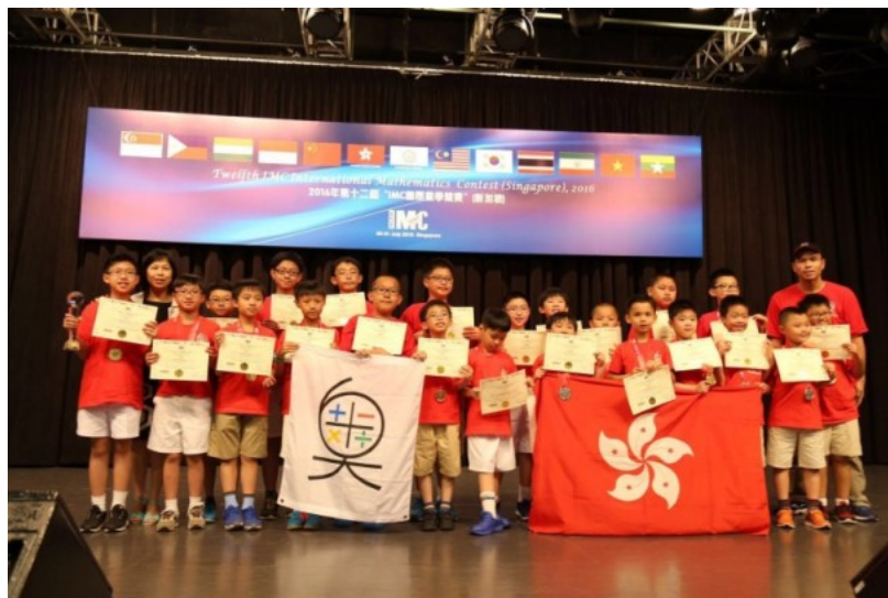
22 名香港學生近日到新加坡出戰國際數學競賽，勇奪 6 金 9 銀 5 銅。

香港數學奧林匹克學校校長梁瑞萍指，學校每年舉行選拔賽，在每級三四千名學生中挑選約 80 人參加為期 1 至 3 個月的培訓，再從中挑選 22 名選手出賽，今次是第 8 年參加該比賽，成績亦是歷屆最好。